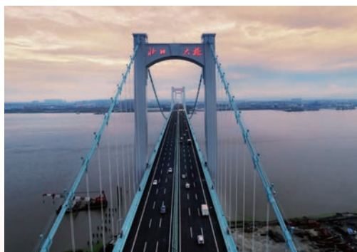
5月27日，世界首座三塔四跨钢桁梁悬索桥——瓯江北口大桥正式通车，标志着浙闽粤沿海大动脉——甬莞高速公路实现全线通车