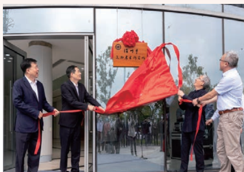
5月19日，温州市文物考古研究所揭牌，将围绕“千年商港、幸福温州”城市定位，整合力量扎实推进考古成果转化，进一步赓续千年城市文脉、彰显瓯越文化魅力