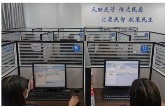
12340社情民意调查热线中心