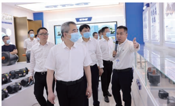
省统计局吴胜丰局长率队来温专题调研统计数字化改革及经济形势

四、求效提能，打造卓越队伍。 今年3月市府办印发《关于进一步加强统计基层基础建设的意见》，5月实现基层统计网格智治全覆盖。2021年5月创新推出“统计之星”评选，并3次迭代升级，通过月度个人、处室和县（市、区）局三个层面的评比，全面调动全市统计系统干部干事创业积极性。该创新举措获省统计局高度肯定。今年4月，创新编印《温州市统计局工作制度手册》；强化“政治、专业、法治、担当、革新”等五大能力建设，打造“专业、精干、高效”的复合型统计队伍。2021年12月荣获全市“模范机关”和市直规范型“清廉机关”称号。