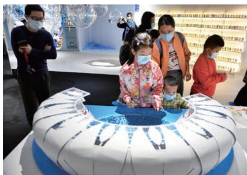
5月15日，“第32个全国助残日暨孤独症儿童当代艺术展”主题活动在温州市图书馆拉开序幕