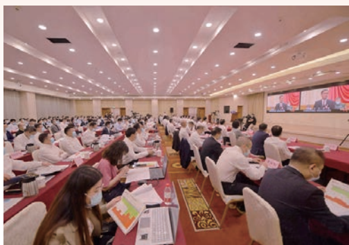
5月6日，2022年第一次“温州擂台·六比竞赛”县（市、区）、产业集聚区比看现场会正式“开擂”，亮晒各地今年以来主要经济指标和重点工作指标，集中比看各地重大产业项目建设情况