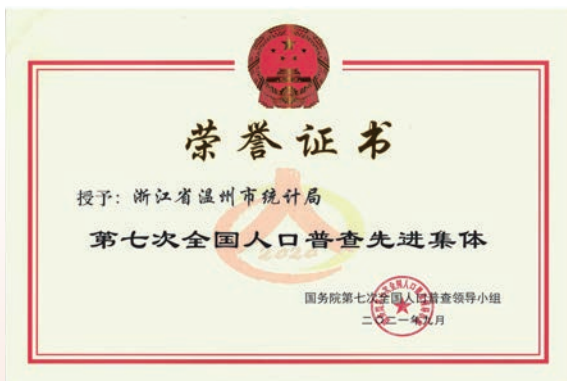
荣获“七人普”国家先进集体