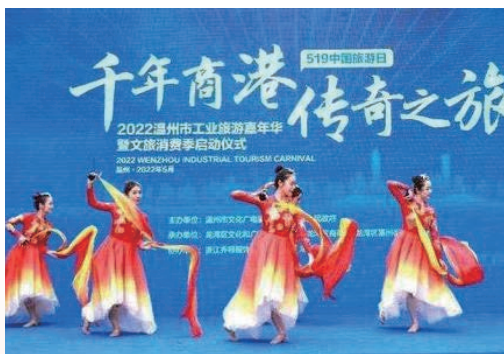
5月19日，在第12个中国旅游日来临之际，2022我市工业旅游嘉年华暨文旅消费季启动仪式在龙湾区举办