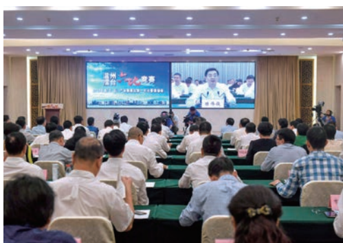
4月23日，市委市政府举行2019年县（市、区）、产业集聚区第一次比看现场会。