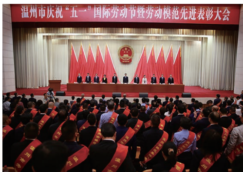
4月30日，温州市庆祝“五一”国际劳动节暨劳动模范先进表彰大会举行。