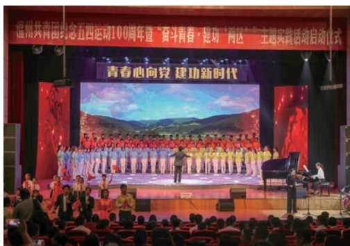
4月26日，温州共青团纪念五四运动100周年暨“奋斗青春·建功‘两区’”主题实践活动启动仪式举行。