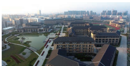
浙江东方职业技术学院