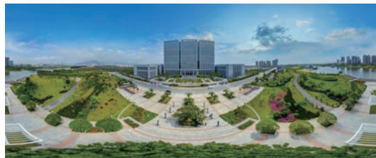
浙南经济总部大厦

2019年，浙南产业集聚区（经开区、瓯飞）管委会将紧扣“奋战一一六一、奋进二〇一九”主题主线，坚决扛起产业平台“五主”使命和责任，围绕“真正成为产业平台、开放平台、科创平台、城市平台和展示我市良好营商环境的重要窗口”，对接大战略，聚焦高质量，招引大项目，培育新动能，全面提升核心区“万亩千亿”量级，奋力谱写大湾区滨海产业新城高能级平台新篇章。