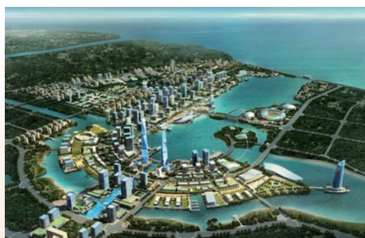
滨海新城核心区效果图