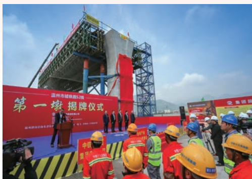
4月12日，市域S2线第一墩揭牌仪式举行，标志着市域铁路S2线进入全面施工阶段。