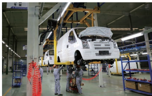
浙江中电汽车集团新能源整车项目车间