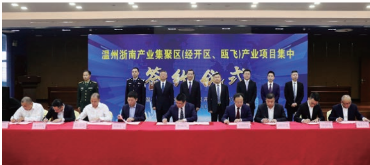
2018年11月，总投资超63亿元的8个产业项目集中签约

2018年以来，在市委、市政府的坚强领导下，浙南产业集聚区（经开区、瓯飞）管委会认真贯彻落实中央和省、市系列决策部署，以及省委巡视整改要求，自觉担当起温州新时代“两个健康”先行区、国家自主创新示范区等建设的“五主”新使命，坚定不移追求高质量发展，经济社会持续保持稳中向好的发展态势。