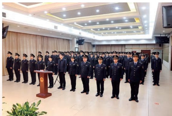
市市场监管局举行执法换装仪式