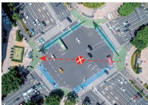
8月，交警在市区车站大道与学院路交叉口推行非机动车“二次过街”，旨在减少非机动车在路口左转时与机动车发生交通事故的可能性