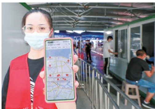
8月，“核酸地图”上线，助力防疫减负增效