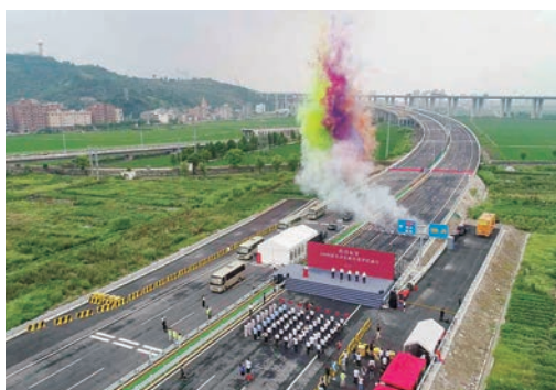
8月31日，浙江温州228国道乐清乐成至黄华段正式通车，乐清到温州龙湾国际机场的距离缩短约30公里