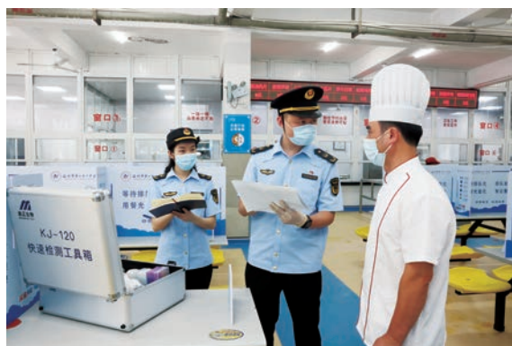
市市场监管局干部检查校园食堂食品安全