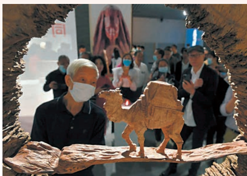
8月3日至5日，文化和旅游部非物质文化遗产司在我市开展“非遗在社区”工作经验交流活动。图为市民观赏高公博木雕作品《一带一路》