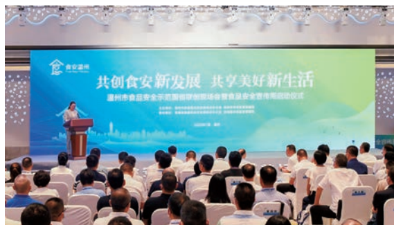
市市场监管局举办“温州市食品安全示范省创建现场会暨食品安全宣传周启动仪式”

三、下好塑造变革“先手棋”，全力激发队伍新活力。 一是打造“和合市监”战队。推出“塑魂强基”队伍建设专题活动，实施“党建引领、文化重塑、砥砺创业、暖心关爱”四大工程，创新开展“我与局长面对面”、市场监管大讲堂、干部荣休入职仪式等活动，有效锤炼“和合”团队文化。二是深化“智慧市监”改革。迭代升级市场监管物联网中心，打造全省领先的“温州市场监管大脑”，集成50多个应用场景，有效提升整体智治水平。全面落实“大综合一体化”改革任务，强化基层市场监管所专业化、规范化、标准化建设，基层所规范化率达100%。三是打响“一流市监”品牌。实施“一年一县（线）一品牌”计划，各地各条线积极向上争取各类试点项目、试点，今年重点争创“四大国创、三大国家级中心、四大国省试点”，形成更多具有温州辨识度的硬核成果，力争各项工作持续走在全省全国前列。