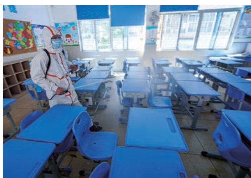
8月底，我市各地学校组织专业人士对校园教室、宿舍、食堂等区域进行消毒，确保学生安全有序入学