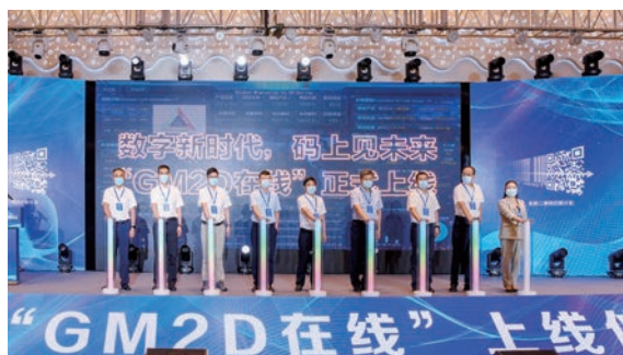
省市场监管局在苍南举办“全球二维码迁移计划（GM2D）”示范区创建启动仪式系列活动