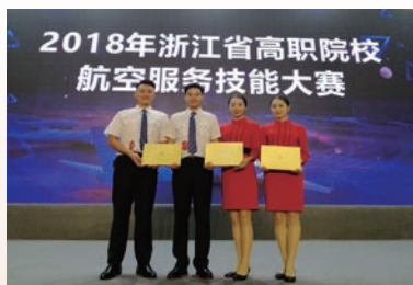
学生在航空服务技能大赛中获佳绩