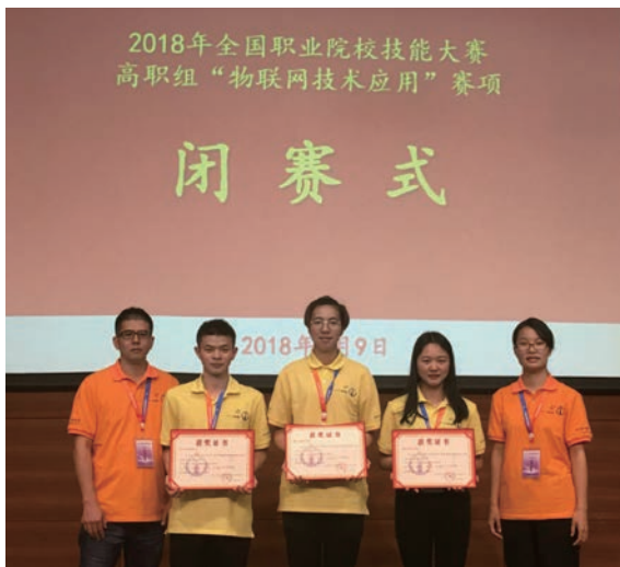
学生斩获全国职业技能大赛二等奖