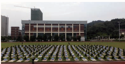
学生接受“准警务化”内务整理训练