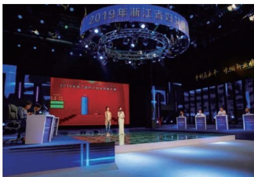
10月16日，浙江省首届妇女创业创新大赛在我市举行