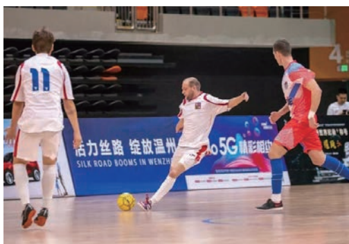
10月14日，2019年“一带一路”国家间群众体育交流比赛在我市开幕