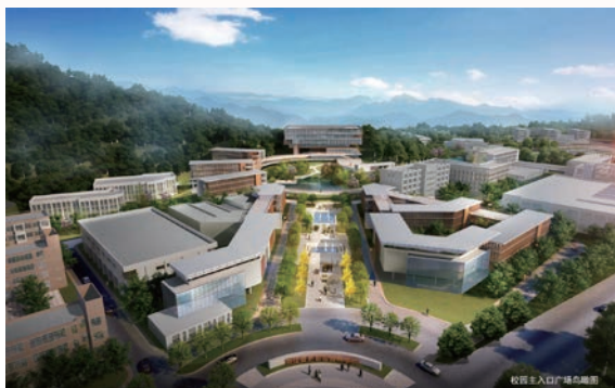
安防学院校园主入口广场鸟瞰图

作为国家重点支持的战略产业之一的安全产业迅猛发展，为安防学院提供了广阔的发展前景。学院将继续实施特色强校战略，不断加强内涵建设、深化改革创新，坚定地朝着成为“本地离不开、业内都认可、国际能交流”的新时代中国特色优质高职院校的目标跨越前行。