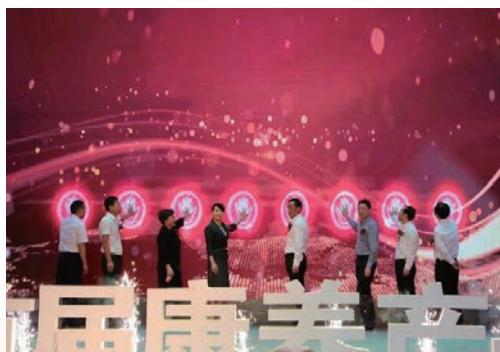
10月18日，我市首届康养产品博览会开幕