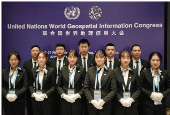
学生服务首届世界地理信息大会深受好评