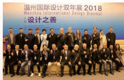
学院主办温州国际设计双年展