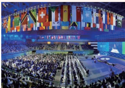
10月26日，2019世界青年科学家峰会在温州举行，国家主席习近平向大会致贺信