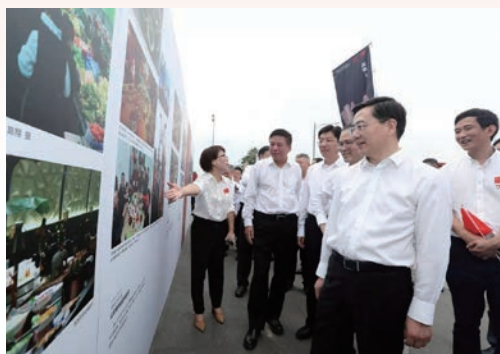
10月1日，我市四套班子领导参加庆祝新中国成立70周年图片展