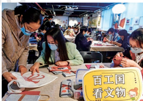
10月21日，国家文物局支持项目“百工魅力进百乡”百工特色展馆在温州南塘正式开馆