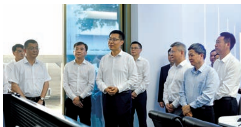
▲ 2021年5月20日，卢山副省长调研瑞安工业经济运行实时监测平台