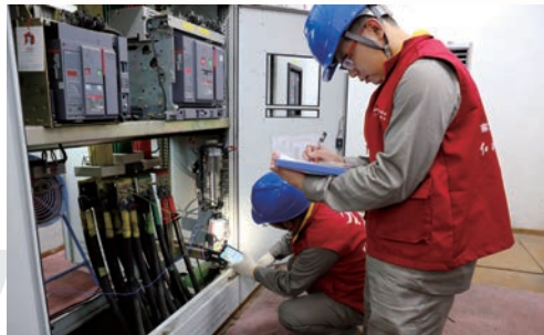
▲ 2020年6月，开始入户为企业安装智慧电务系统

开发三类七大应用场景：一是基于全时分析拓展“助企服务”应用。根据用电实时监测，划定“停产、减产、增产”等6种产能状态和“锐减、平稳、激增”3种环比状态，及时预警发现企业及项目苗头性、潜在性问题。二是基于全景监测拓展“两链提升”应用。通过“多能监测全景”等板块，匹配企业用电、税收、销售额等数据，精准分析“两链”及企业经营效率，有效杜绝瞒报、漏报、虚报等现象，累计规范企业生产经营问题120多个，为科学研判工业经济及“两链”运行趋势提供有效支撑。三是基于全程预警拓展“本质安全”应用。通过“安全用电监测模块”，对电气设备导线过热、过载、漏电等三大隐患进行24小时实时监测，同时对4000多个站点实施专业电力运维托管，可第一时间发现电气线路、用电设备异常，并向用户手机发送预警信息，同步派发工单消除隐患。