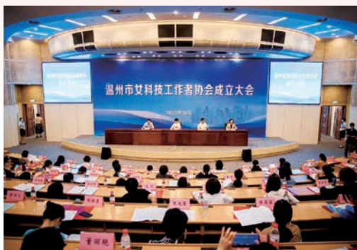
10月8日，温州市女科技工作者协会成立大会在市人民大会堂召开，全市女科技工作者有了自己的“娘家”