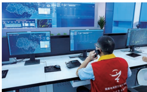
▲ 2020年6月，瑞安市工业用电实时监测平台投入使用