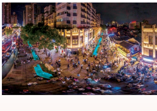
十一黄金周，我市累计接待游客924.00万人次，同比增长23.92%；实现旅游营业收入1.52亿元，同比增长6.31%，图为十一期间，市区五马步行街、公园路、纱帽河等街区热闹非凡