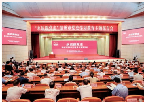
10月12日，“永远跟党走”温州市党史学习教育主题报告会在市人民大会堂举行