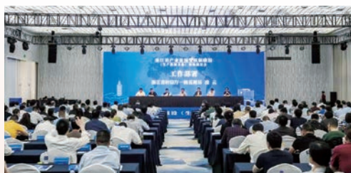
▲ 2021年5月21日，省产业链预警机制建设现场推进会在瑞安召开