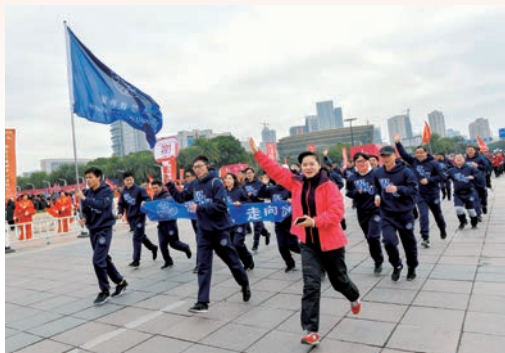
1月1日，2019年温州市元旦升旗仪式暨“中国金茂杯”健身跑活动举行。