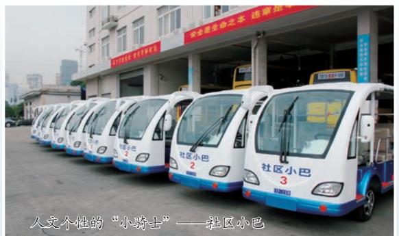
人文个性的“小骑士”——社区小巴