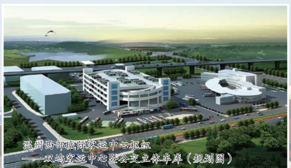
温州西部城际客运中心枢纽——双屿客运中心暨公交立体车库(规划图)