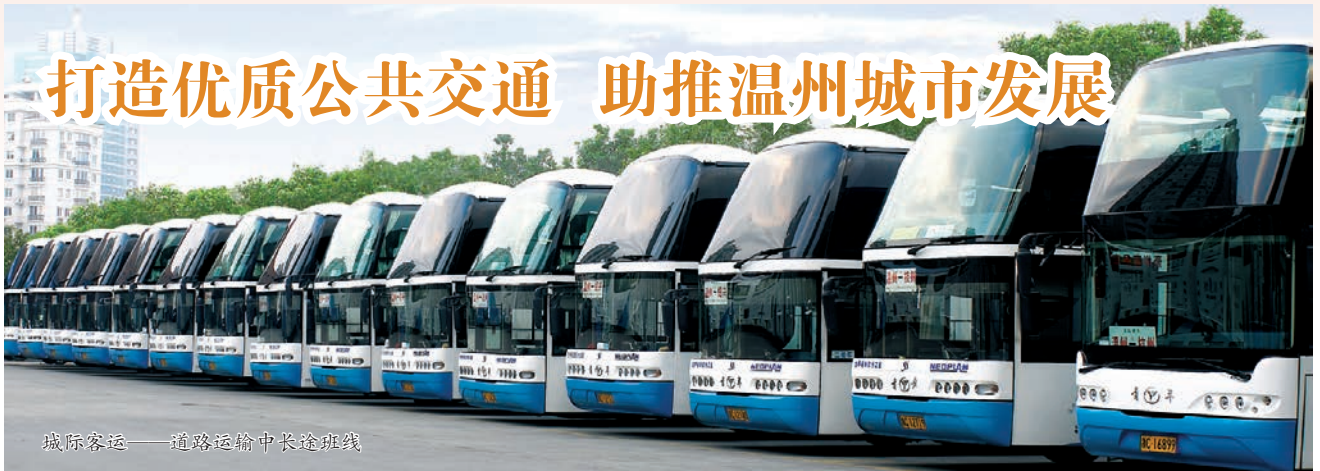
城际客运——道路运输中长途班线

温州交运集团系温州市直属国资营运公司之一，于2010年12月成立，员工1万余人，拥有各类运输车辆5000余辆，主要从事城市公交、城乡交通、城际客运、货物流通等民生服务。目前公交年客运量约2.8亿人次、公共交通出行分担率28.7%；城际年客运量约560万人次，周转量14亿人公里。