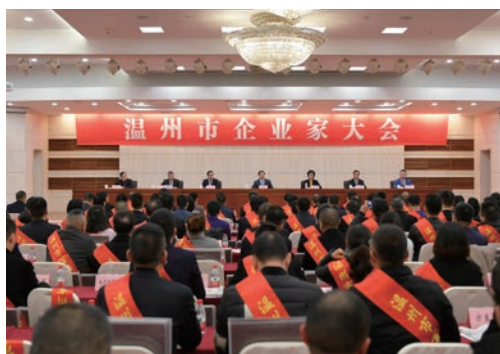
1月16日，温州市企业家大会在市人民大会堂四楼多功能厅举行。