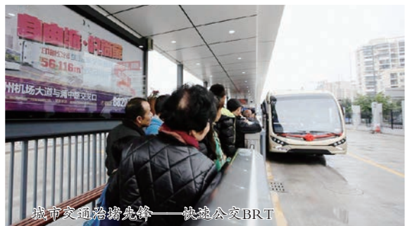
城市交通治堵先锋——快速公交BRT

新时期，温州交运集团将继续以服务公共交通民生为根本，通过“产业、服务、管理”三大转型，落实“把公交做优、把城际做活、把副业做好、把管理做精、把党建做强”五大举措，向着“打造省内领先、国内一流的人民满意公共交通”目标而努力，积极为我市实现经济社会高质量发展新目标贡献力量。