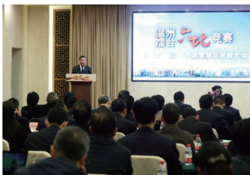
1月15日，“温州擂台·六比竞赛”县（市、区）、产业集聚区述政大会举行。