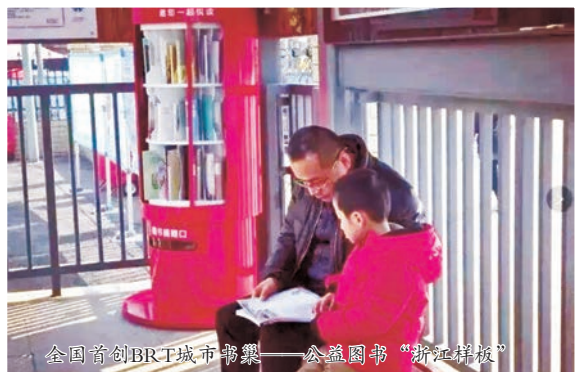
全国首创BRT城市书巢——公益图书“浙江样板”