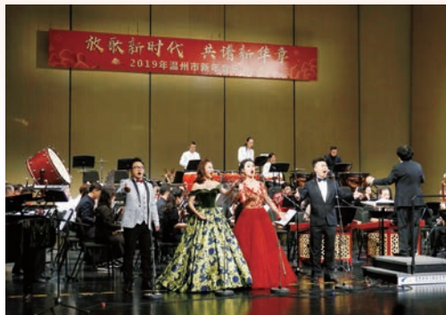
1月6日，“放歌新时代 共谱新华章”2019年温州市新年音乐会在温州大剧院举行。