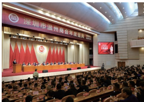
1月31日，深圳市温州商会年度盛典在市人民大会堂举行。