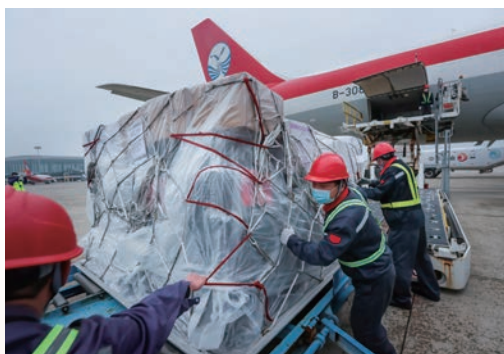
2月14日，温州市政府包机将海外华捐赠的抗疫物资 横跨欧亚接运回温