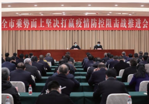
2月8日，省委常委、市委书记陈伟俊部署疫情防控工作，指出要“再战十天，锁定胜局”；2月19日，省委常委、市委书记陈伟俊再次部署，强调要“决战十天，力夺双赢”