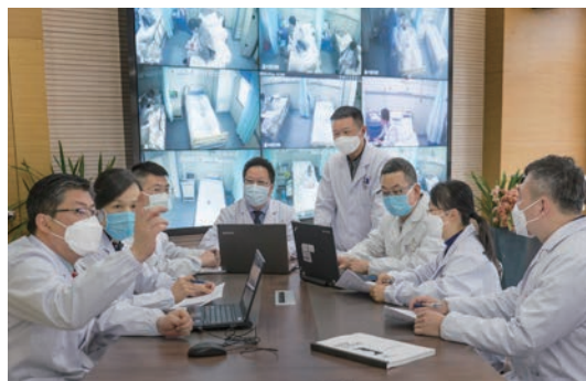
温州市中心医院(温州市第六人民医院)专家组会诊研判患者病情

二瓯江口院区仅用一周开设床位800张,全市共设定点医院10家,开放床位共1474张,加上后备床位总数达2150张,2036名医护人员奋战一线,所有病例及时高效全收治。