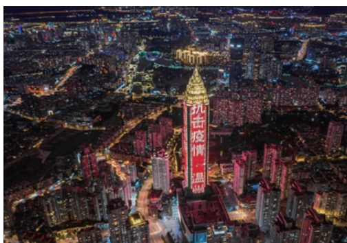
2月6日，温州城市新地标世贸中心亮起灯光秀字幕打出“万众一心、抗击疫情、温州必胜”等字样，为抗击疫情加油鼓劲