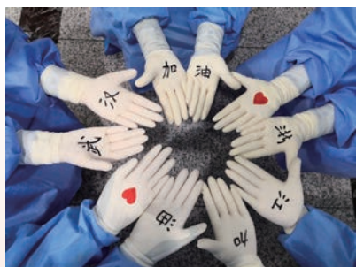
在武汉第四医院支援的温州援鄂医疗队队员为武汉和浙江加油

二瓯江口院区仅用一周开设床位800张,全市共设定点医院10家,开放床位共1474张,加上后备床位总数达2150张,2036名医护人员奋战一线,所有病例及时高效全收治。