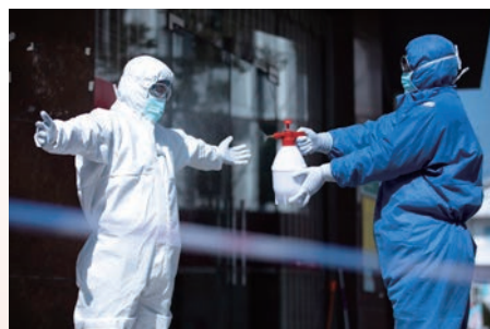
平阳县山门中心卫生院正在给隔离点采样回来的医生进行消毒