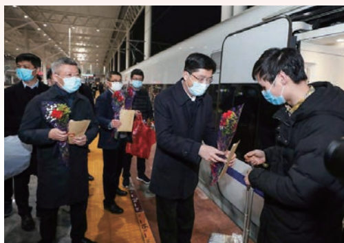
2月23日，我市迎来首趟复工专列，市委副书记、市长姚高员率队迎接来温企业员工