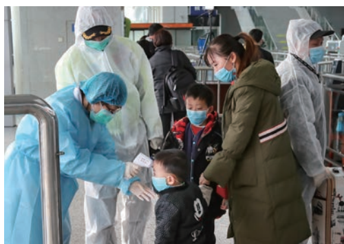
2月8日，我市实施《关于乘势而上坚决打赢疫情防控阻击战的“12条”深化措施》，图为温州铁路南站入口医务人员正在测量体温