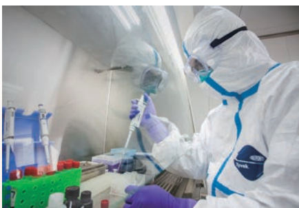
泰顺县疾控中心 医生正在做核酸检测