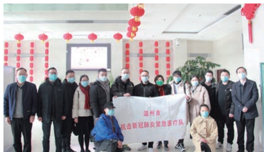
第二批温州援鄂医疗队出征