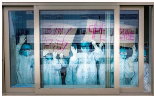
温州医科大学附属第一医院新冠肺炎救治团队成员为中国-温州加油

卫健人有“能”的行动,迅速应战保健康。 在首例病例确诊前,全市33家二级以上综合医疗机构已设置24小时发热门诊,超前安排疫情监测工作。疫情发生后,围绕提高治愈率和收治率、降低感染率和病死率的目标,迅速开辟医疗救治的三大战场,市第六人民医院仅用5个小时组织到位,重症、危重患者由温医大附一集中收治,温医大附