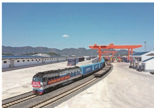
3月19日，“永康-温州-东南亚”快速航线开通，这标志温州港首次实现海铁联运直航出海，为浙西地区外贸客户提供了更高效的出海通道