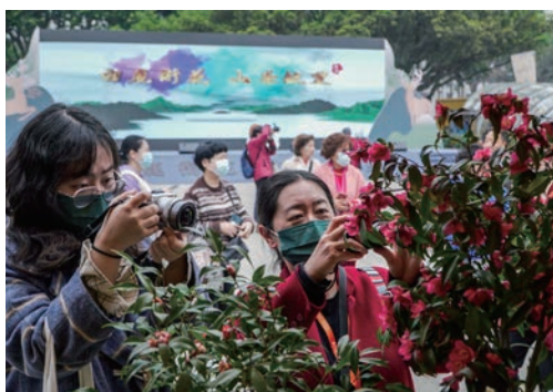
3月5日，第十三届中国茶花博览会在温州九山公园正式拉开帷幕