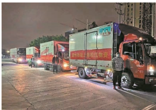
3月30日，我市紧急调配的45吨生活物资顺利抵达上海松江区，助力当地战“疫”