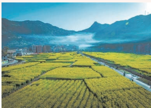
3月，温州各地油菜花田成为打卡新宠，各地发展起集赏花旅游、休闲娱乐、增收致富为一体的“花经济”，图为洞头大门岛油菜花