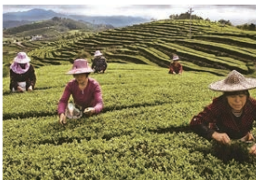
3月，我市早茶集中上市，图为泰顺县仕阳镇万亩茶园春茶采摘忙