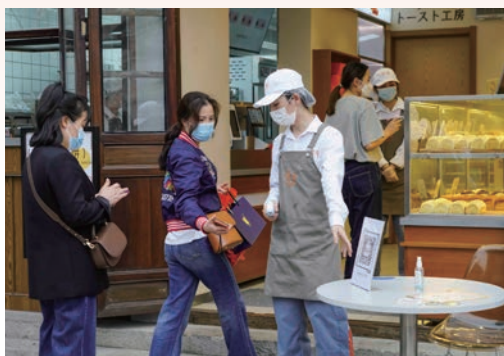
3月，“温州防疫码-场所码”上线，为精准防疫提供重要支撑，图为市区公园路，顾客扫“温州防疫码-场所码”后才能进入店内选购商品