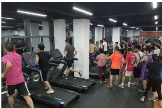
▲ 市民在百姓健身房锻炼