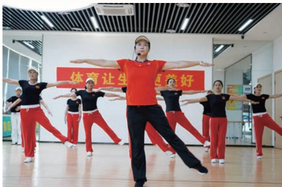
▲ 社会体育指导员在鹿城区南塘百姓健身房授课

四是强化数字化利用,做好“升级发展”文章。 开发全国首创的“温州百姓健身房”微信小程序。建成2.0版百姓健身房9家,3.0版百姓健身房1家。数字化百姓健身房配备智能化健身器材,具有多媒体网络功能。3.0版实现微信排名、科学指导、健身提醒等功能。满足多个百姓健身房异地网络实时比赛,提高趣味性和对抗性,打造后疫情时期群众健身的创新载体。