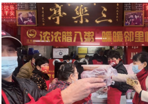
1月10日腊八节，温州市区上百个施粥点的义工们把一份份热乎乎的腊八粥分发给群众、清洁工、快递小哥和出租车司机等