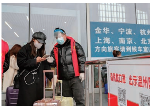
1月16日是春运第一天，铁路温州南站坚持防疫保畅两手抓，多措并举让旅客顺利便捷返乡