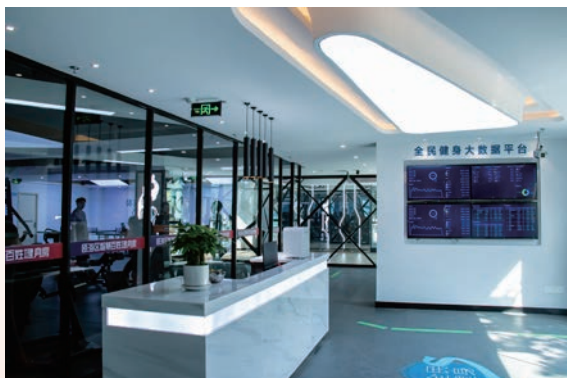
▲ 瓯海区智慧百姓健身房一瞥