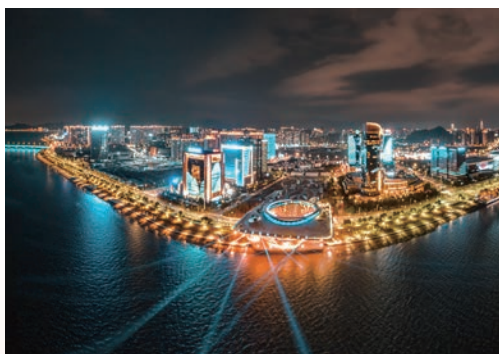
1月29日，除夕之夜的温州市区城市阳台、CBD显得绚丽多姿