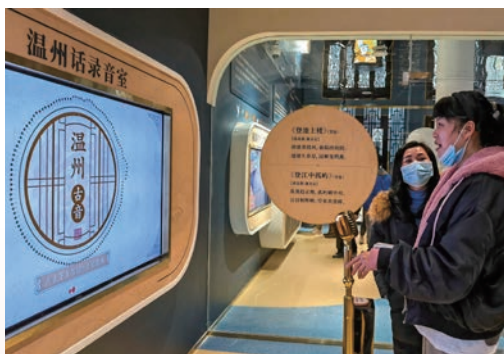
1月27日，浙江省首座方言馆——叮叮当童谣馆在温州松台山正式开馆