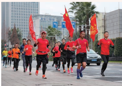
1月1日，我市第39届元旦健身跑首次线上举办，选手可在任意地点完成线下跑步、线上打卡，我市7952人奔跑迎“新”，“跑”进新年