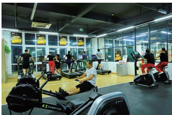
▲ 市民在鹿城区藤桥百姓健身房锻炼