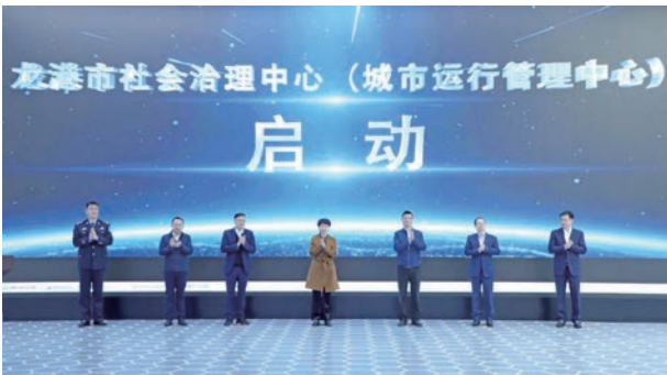
2022年2月15日，龙港市社会治理中心（城市运行中心）启动运行

三是监督“一览无余”。建立监督评价指标体系，每月统计部门、社区的事件数、完成率、满意度等指标数据，形成监督对象立体画像。创新推出检察监督特色场景，对全量事件进行关键线索自动检索，针对不规范行政行为，由检察院提出检察建议，并在线督促整改。目前，已提出69条检察建议，完成整改35条。