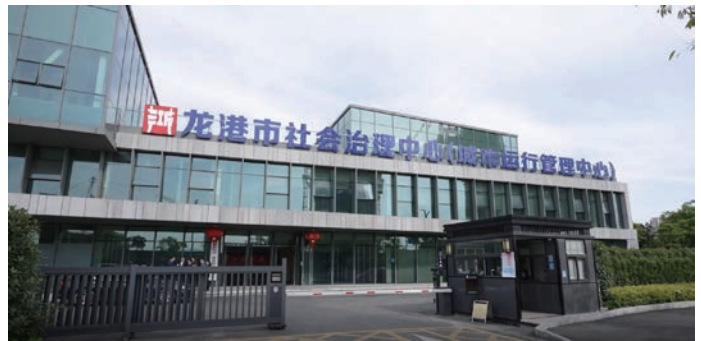
龙港市社会治理中心