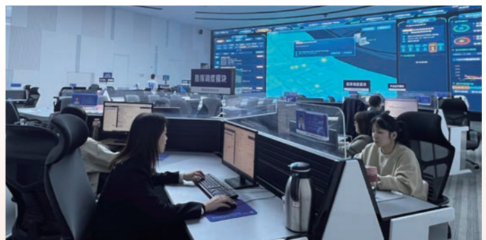
龙港市社会治理中心日常工作