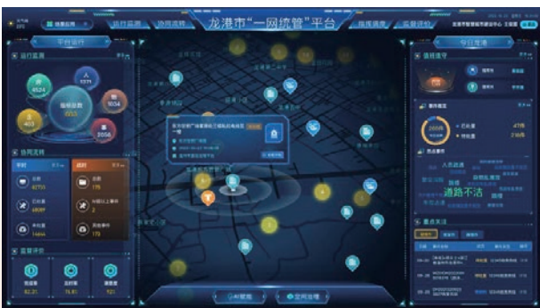
龙港市社会治理中心“一网统管”平台