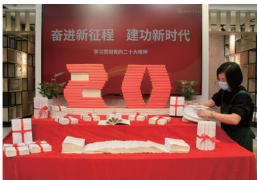
10月28日，温州新华书店收到首批400本最新出版的党的二十大精神报告单行本，第一时间在温州书城内设专柜布展