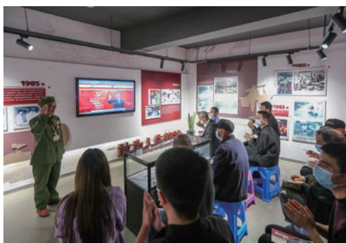
龙湾革命教育纪念馆，老兵宣讲团成员为社区党员开展党的二十大精神宣讲