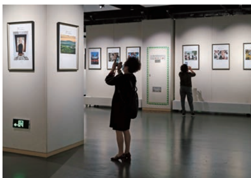
10月24日，“中国·温州—匈牙利·佩奇摄影艺术联展”在我市文化馆开幕，展出100幅表现东西方自然、生活与艺术的优秀摄影作品