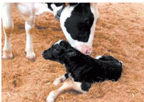
我省首例遗传改良“胚胎牛”在泰顺出生，健康状况良好