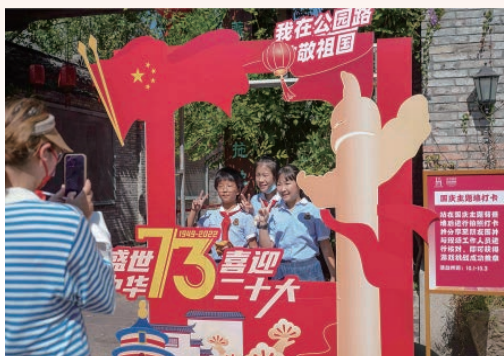
市民在市区公园路国庆主题墙前留影，在“中国红”的氛围中开启国庆假期