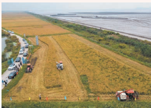
10月8日，在全国第六个海水稻种植基地——瑞安市丁山二期一号农业地块，1500亩成方连片籼稻品种的“海水稻”迎来丰收