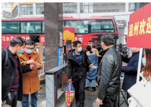
我市为响应节后返工潮市场需求，启动省际“点对点”劳动力输转行动，在做好疫情防控基础上，确保务工人员“出家门进车门，下车门进厂门”