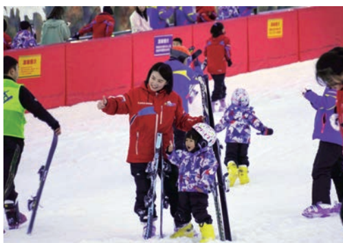
冬奥会极大激发了市民广泛参与冰雪运动的热情，图为市民在我市桃花岛冰雪运动中心体验冰雪运动