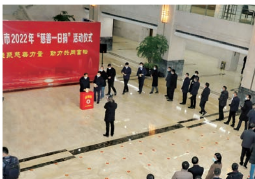
2月22日，我市2022年“慈善一日捐”活动在市行政中心启动，该活动已连续开展22年，是善款募集主渠道，去年，全市慈善总会系统共募集善款5.53亿元，受益群众达33.87万人