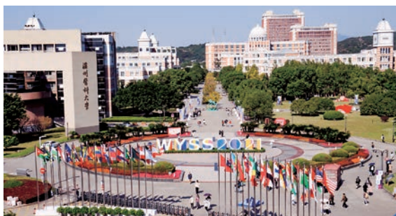
▲ 世界青年科学家峰会主会场设在温州医科大学