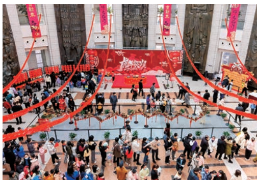
2月15日，市博物馆举办元宵游园会，为市民准备了猜灯谜、赏龙档、做灯笼、拓片等多项寓教于乐的游园项目，让市民感受到浓浓的传统节日氛围