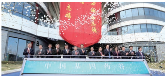
▲ 中国基因药谷启用仪式