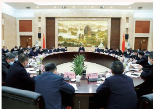
2月22日，温州市委市政府召开“一季稳”工作专题汇报会，省委常委、市委书记刘小涛强调，要把“一季度稳增长”作为大战大考来抓，推动各项工作迈上新台阶，奋力实现“一季稳、开门红”