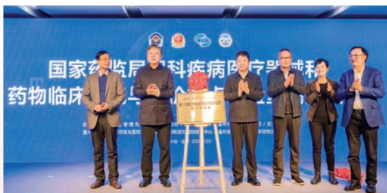
▲ 国家药监局眼科疾病医疗器械和药物临床研究与评价重点实验室揭牌仪式