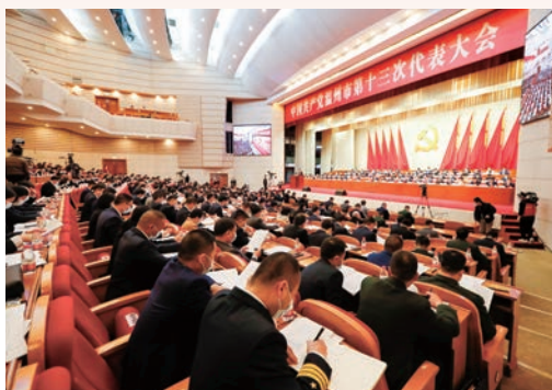
2月24日，中国共产党温州市第十三次代表大会隆重开幕