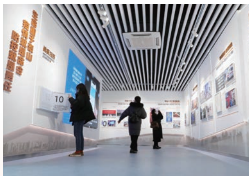
12月31日，温州防疫馆在杨府山公园开馆，以城市之名致敬温州战“疫”力量