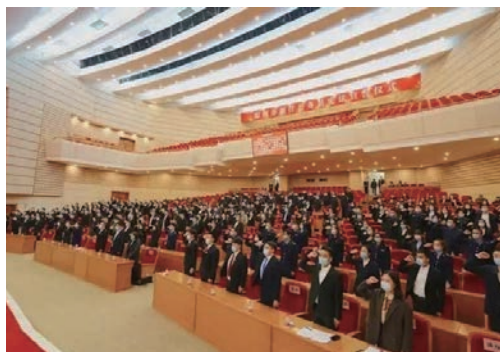
12月30日，我市241名新任公务员面对国徽庄严地向宪法宣誓