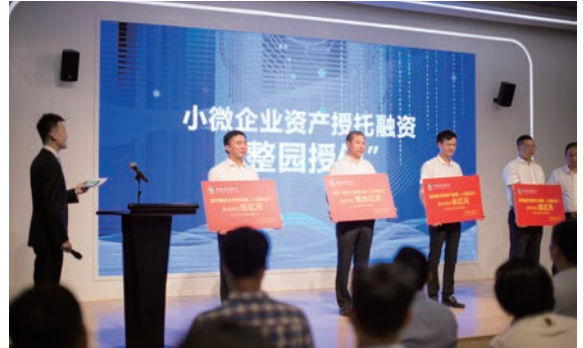
2020年7月1日，瓯海区“普惠金融服务站”揭牌仪式

在综合运用“线下”实地走访摸排的基础上，充分发挥数字手段，通过“信用分”以及风控模型，严控贷款准入。同时，在放贷环节，通过积极发挥普惠金融服务站及协贷员桥梁作用，定期对已放贷企业开展回访，并动态关注企业“信用分”变化情况，有效强化小微企业贷款过程管理。对贷款违约企业由政府、园区、银行与企业进行协同调解，引导企业协商处置受托资产，强化“软约束”。同时，加强部门联动，对于协商无法处理解决的风险，采取多部门联合惩戒、公开曝光、重点监管等举措，对恶意逃废债企业增强威慑力，筑牢风控网络。