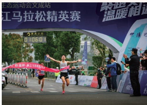
12月13日，2020年浙江省首届生态运动会在文成县举行，共设马拉松、山地自行车、越野汽车丛林穿越、风筝、冰雪运动、小龙舟等6个竞赛项目