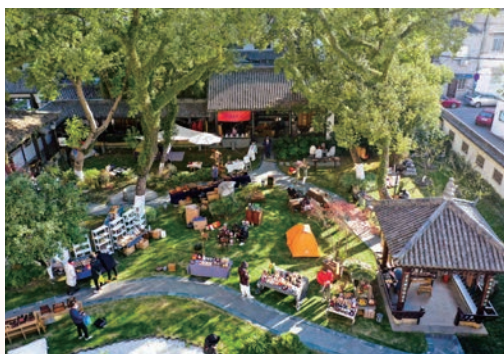
12月31日，鹿城区“墨池雅集”春市活动在墨池公园举行，现场展示了文玩茶具、竹木银器、瓯窑瓯绣、书画手作等等，还开展了书法家送福送春联活动