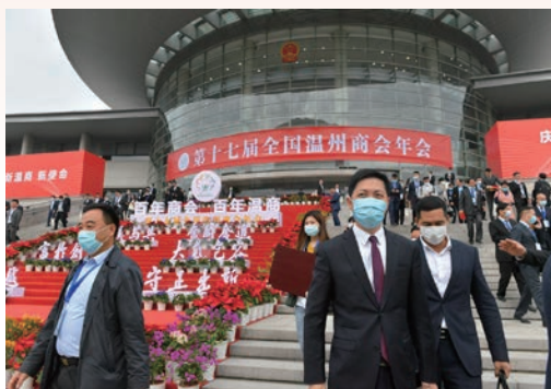
12月1日，第十七届全国温州商会年会在市人民大会堂举行