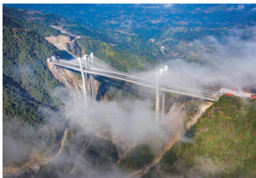
12月22日，溧宁高速公路文成至泰顺段高速正式通车，我市全面实现“县县通高速”