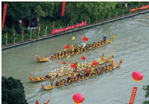
6月14日，端午节当日，20多支龙舟队汇聚市区南塘河水域，展开激烈对决