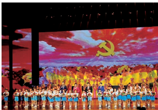
6月28日，我市开展中国共产党成立100周年“七一”表彰暨文艺演出，市四套班子主要领导、市委常委为“光荣在党50年”老党员代表和市“两优一先”代表颁奖