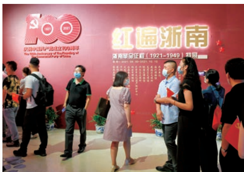
6月30日，温州博物馆开展“红遍浙南”浙南革命征程（1921—1949）特展