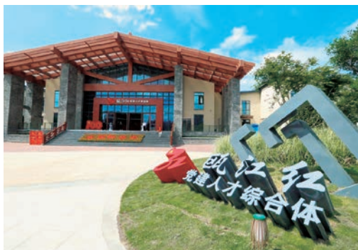
6月25日，“瓯江红”党建人才综合体揭幕