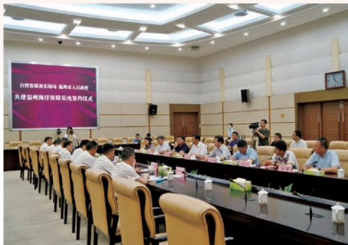
6月22日，国家自然资源部东海局和我市举行共建温州海洋保障基地协议书签约仪式