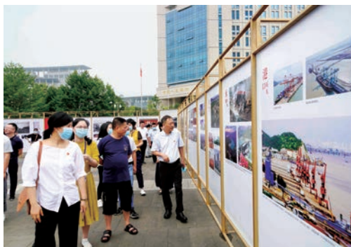
6月25日，《百年荣耀·潮涌瓯江——温州市庆祝中国共产党成立100周年大型图片展》在温州大剧院广场及室内盛大开幕